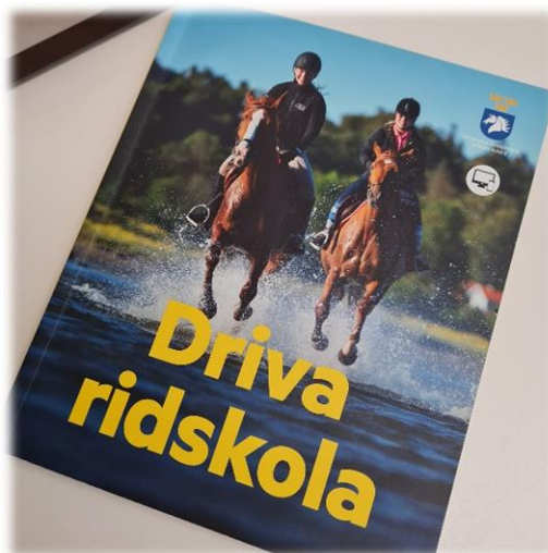
Digitala Ridskolechefsträffar är fortsatt ett stående inslag i vår kalender.