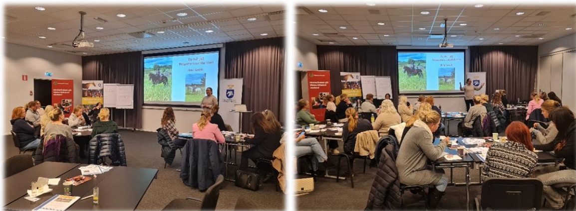
Bilder ifrån årets Ridskolekonferens med temat "Social License to Operate – Ridskolan roll"

Under året har vi anordnat flera utbildningar/träffar, en del digitala och del fysiska. Det har utbildats nya Ungdomsledare, Ridledare och ännu fler har genomgått Ridsportens Basutbildning. Vi har fortbildat både Grönt Kort-utbildare, ridlärare- och ridskolepersonal och även olika tävlingsfunktionärer. Vi arbetar allihop ständigt med att tillsammans utveckla ridsporten!