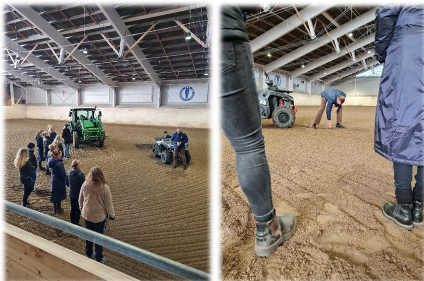
Bilder ifrån en utav våra Fortbildningar – Ridskola, detta tillfälle "Ridbaneunderlag".

Idag hade vi sista digitala Ridskolechefsträffen för denna terminen! 🎉 🙌👏 Ett härligt gäng som självklart kommer "ses" igen nästa termin! #västergötlandsridsportförbund #tillsammansutvecklarviridsporten