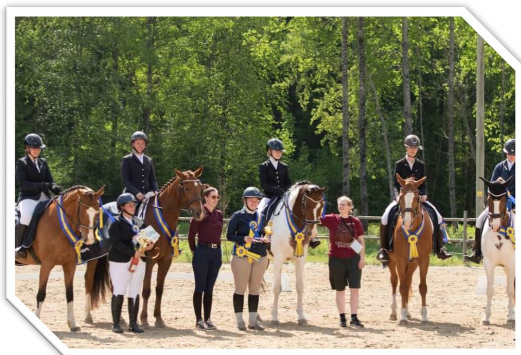
Eds Ryttarsällskap – vinnare dressyrallsvenskan div III