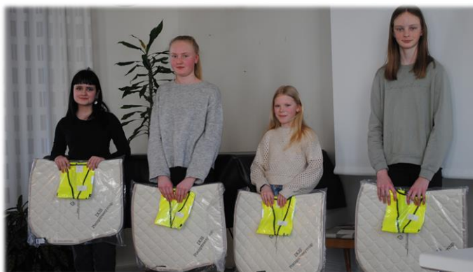
Pristagare DUS Ponnydressyr cup 2023