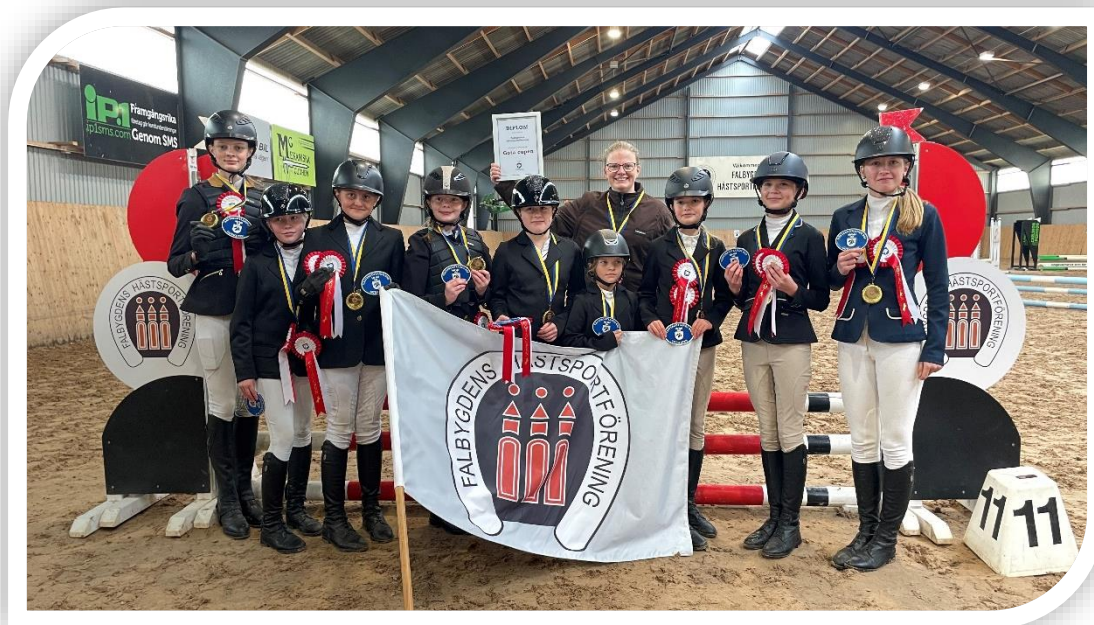
Falbygdens Hästsportförening – vinnare Gota ponnyhoppning