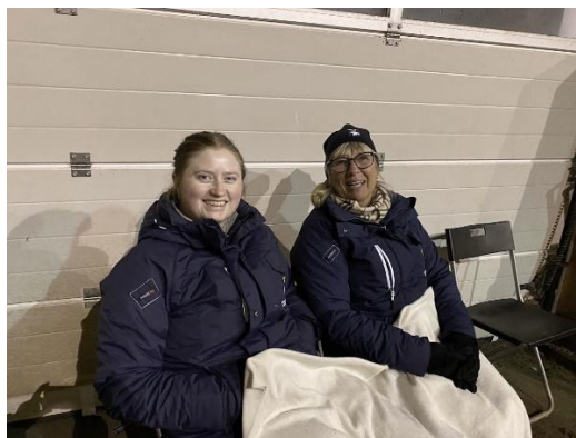
Kansliet under uppsutten träning med ryttarutveckling