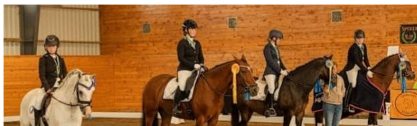
Guld DM Lag