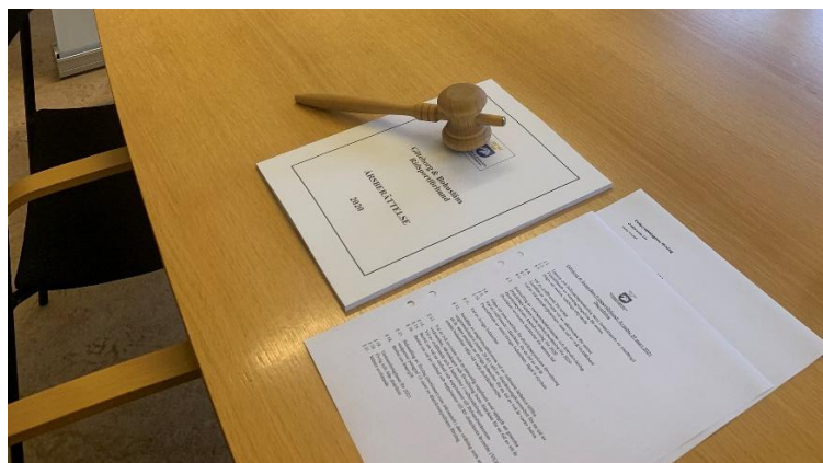
Årsmöte – ridsportens demokrati