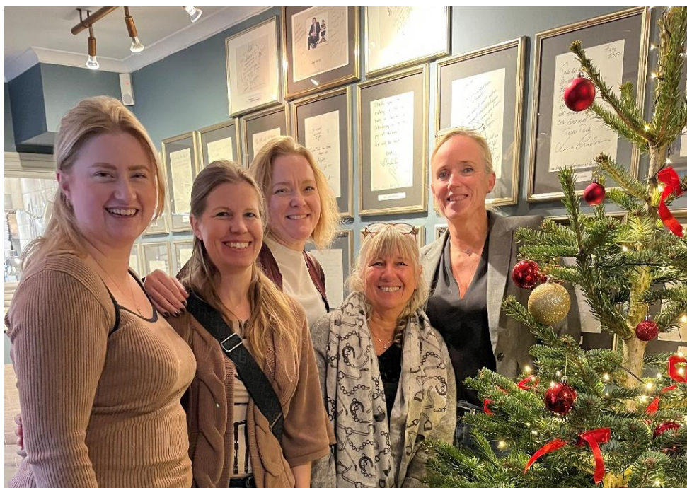
Julbord tillsammans med Västergötlands Ridsportförbund

Vi fortsätter att samarbeta med närliggande distrikt såsom som det har gjorts under många år tillbaka. Vi samverkar både med Västergötland och Hallands Ridsportförbund och då framför allt med tävlingsverksamheten och utbildningar. Vi har som målsättning att nyttja våra resurser till våra medlemmar på ett maximalt sätt, öka medlemsnyttan, ge bättre service och stöd i det som är vårt basutbud.