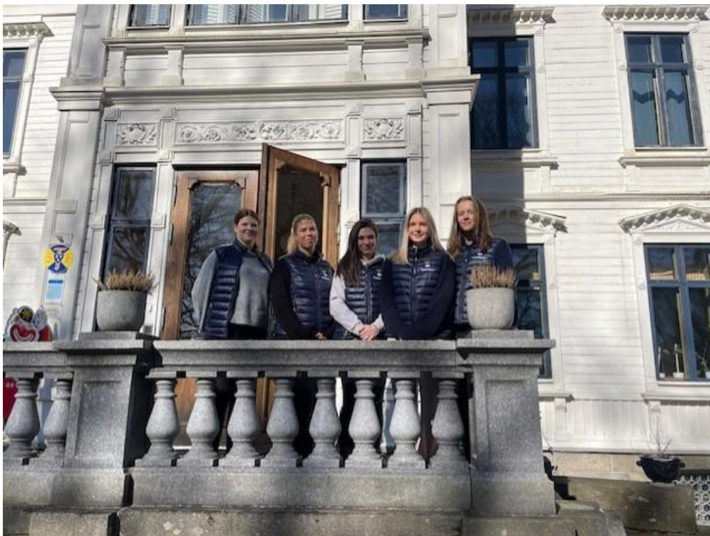
Delar av DUS