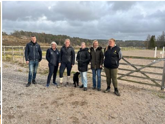
Besök hos Sotenäs FRK & Bohusläns HSK