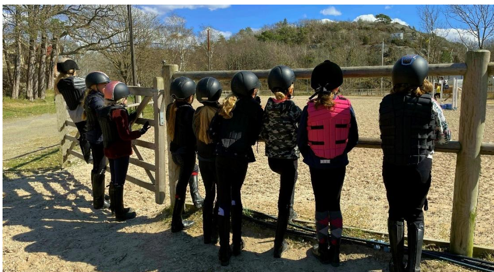
Framtidens ryttare

För att säkra finansiellt stöd kommer vi att fortsätta arbeta med att locka sponsorer till vår tävlingsverksamhet och fortsätta informera om och främja Ryttarutveckling nivå 2 i distriktet. Vidare kommer vi att utveckla och främja samarbetet över distriktsgränserna för att skapa en starkare och mer enhetlig tävlingsmiljö.