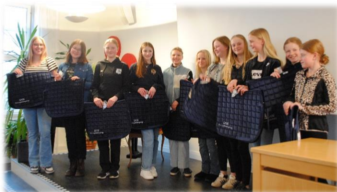
Pristagare DUS Ponnydressyr cup 2022