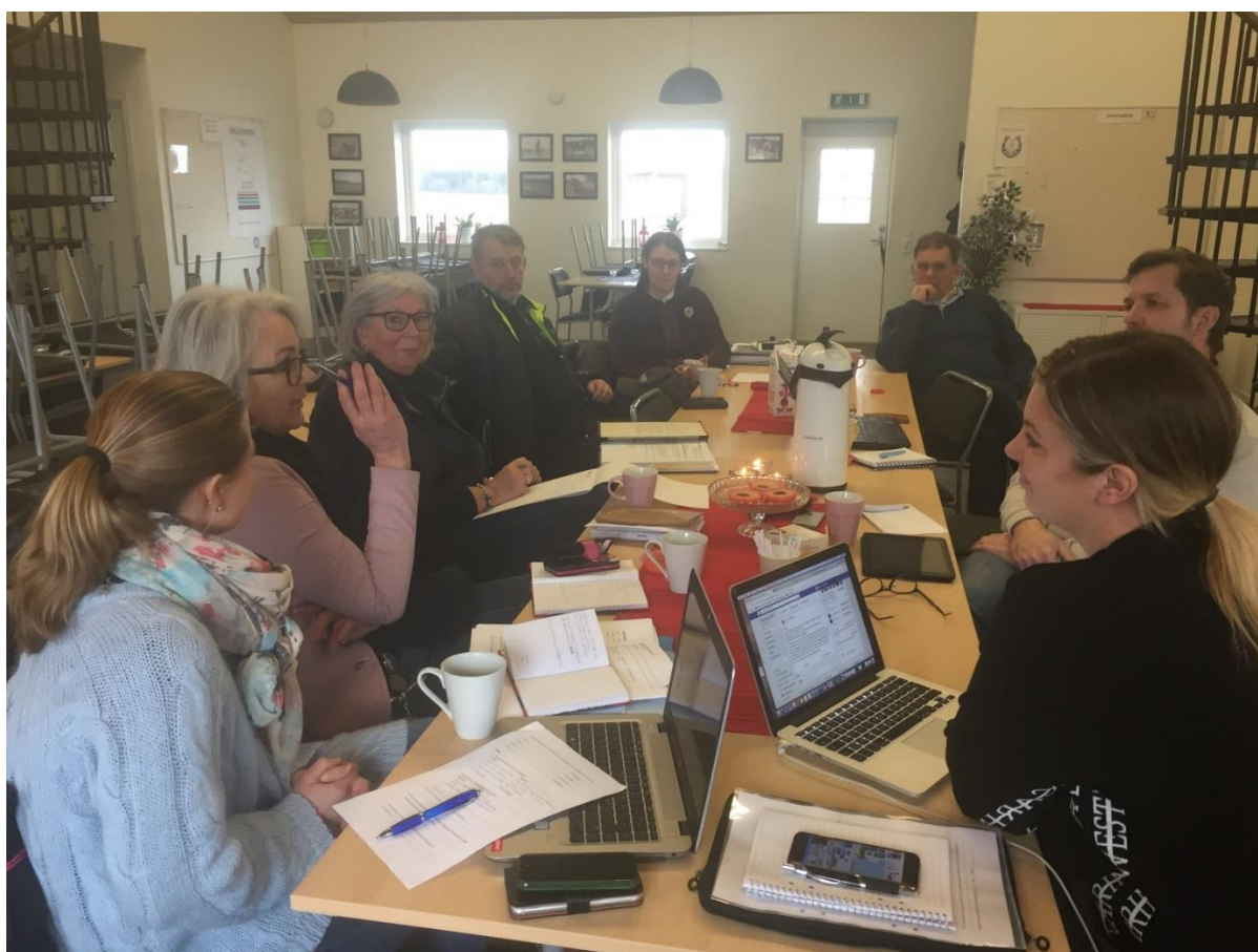
Besöksgruppen, tillsammans med Ioff, Idrott- och föreningsförvaltningen, ute hos Ghsk och GHCC på deras anläggning på Säve Galopp.