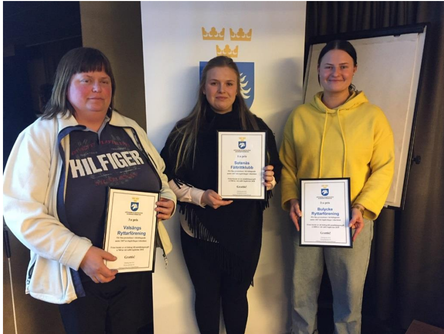
Sotenäs Frk, Bulycke Rf och Valsängs Rf fick utmärkelser på vårt stormöte under våren, onsdagen den 21 mars 2018 för fina prestationer under 2017