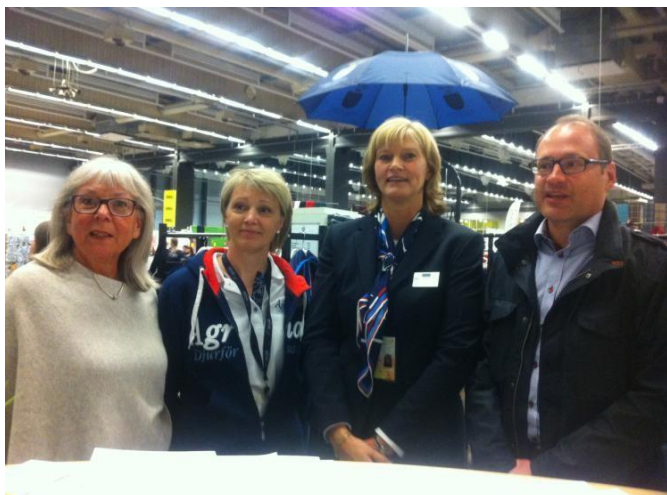
Representanter från Agria, Hööks och distriktet

Avtal har, även i år 2018, skrivits med Hööks Hästsport om sponsring av priser till vår Bohuscup för ponny och häst i både hoppning och dressyr under 2018. Agria sponsrade DM med täcken till segrarna under 2018.