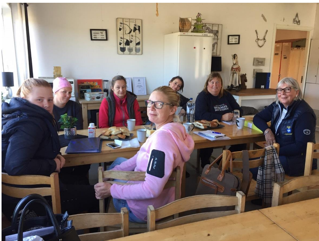
Trevligt möte ute hos Valsängs Rf med Besöksgruppen