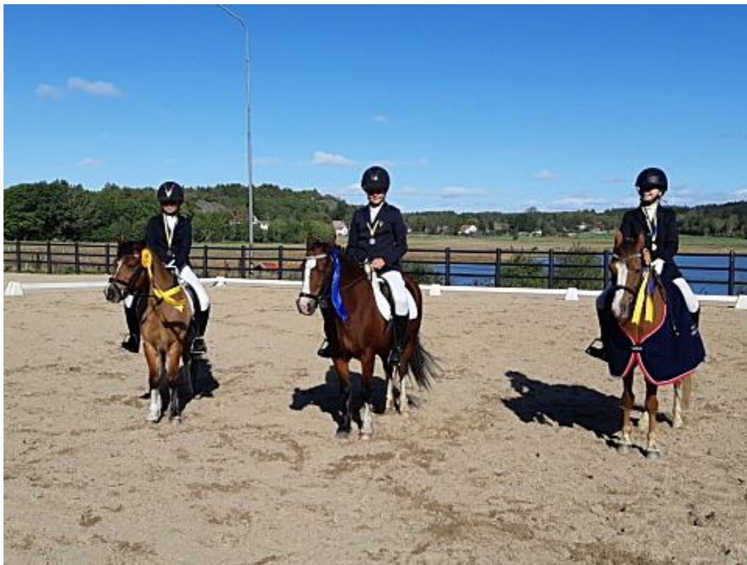
DM för ponny dressyr avgjordes på Tjörns Ridklubb