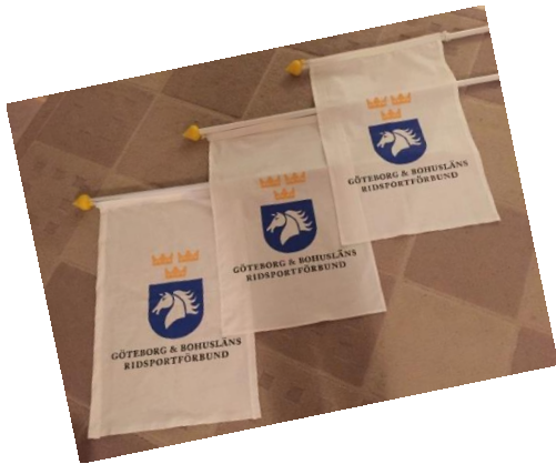
Distriktets nya flaggor inför Lag SM