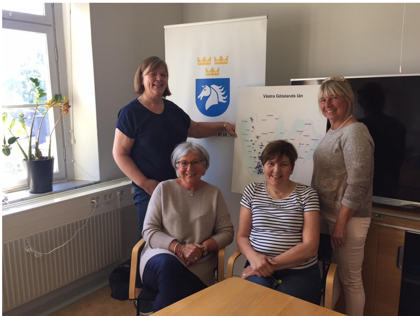
Regionträff med ordförandena och konsulenterna i Västergötlands- och Göteborg & Bohusläns Ridsportförbund