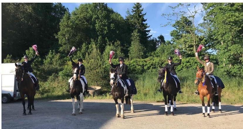
Munkedals lag vann Bohuscupen dressyr häst, Grattis!