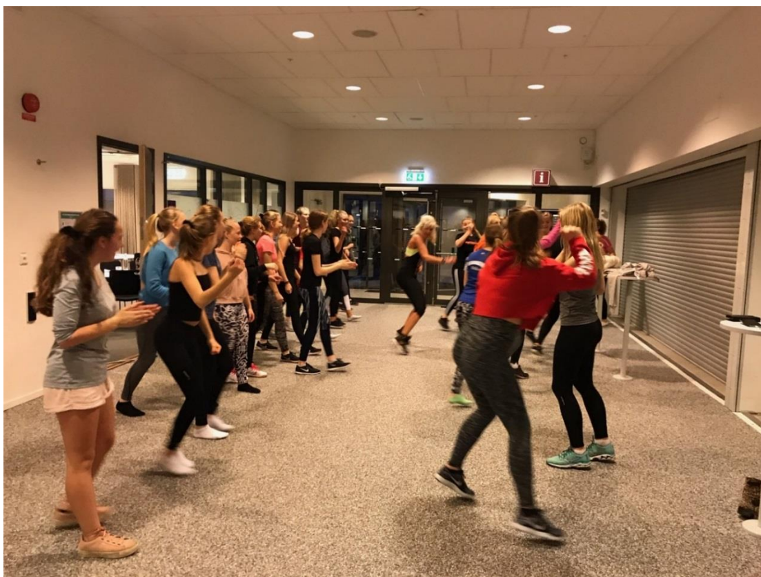
Träningspass under Ulk 1 den 10-11 nov-18