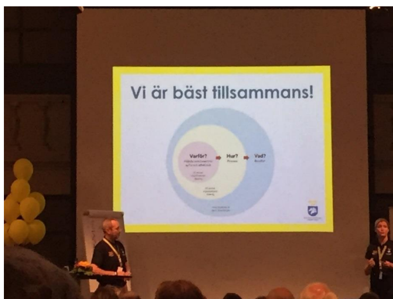
Vi är Bäst Tillsammans!

Utveckla kommunikation styrelse-kansli-sektioner-medlemmar.