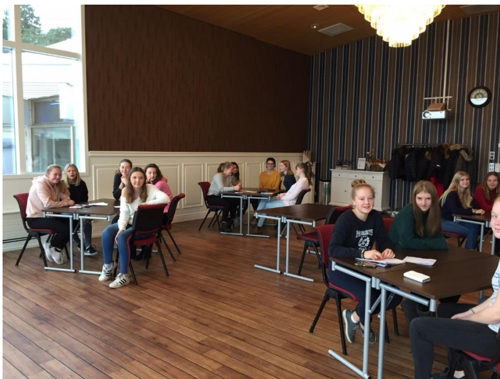
Du bjöd in alla US i distriktet till en konferens ”Utmaningar och Framgångar 24 nov på Stenungsbaden, Foto Kerstin Gunnesson