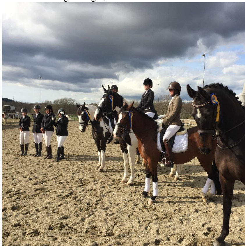
Stolta pristagare i Bohuscupen dressyr hos Stora Höga Rk som anordnande en omgång i cupen den 29 april 2018