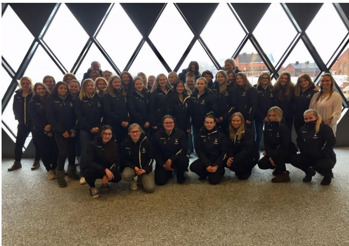
Ungdomsledarkursens tredje steg 2018 med ”nybakade” ungdomsledare