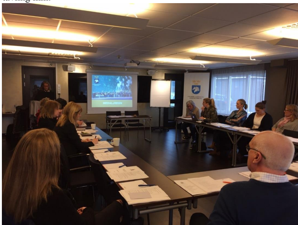
Årsmötesdeltagare 2018