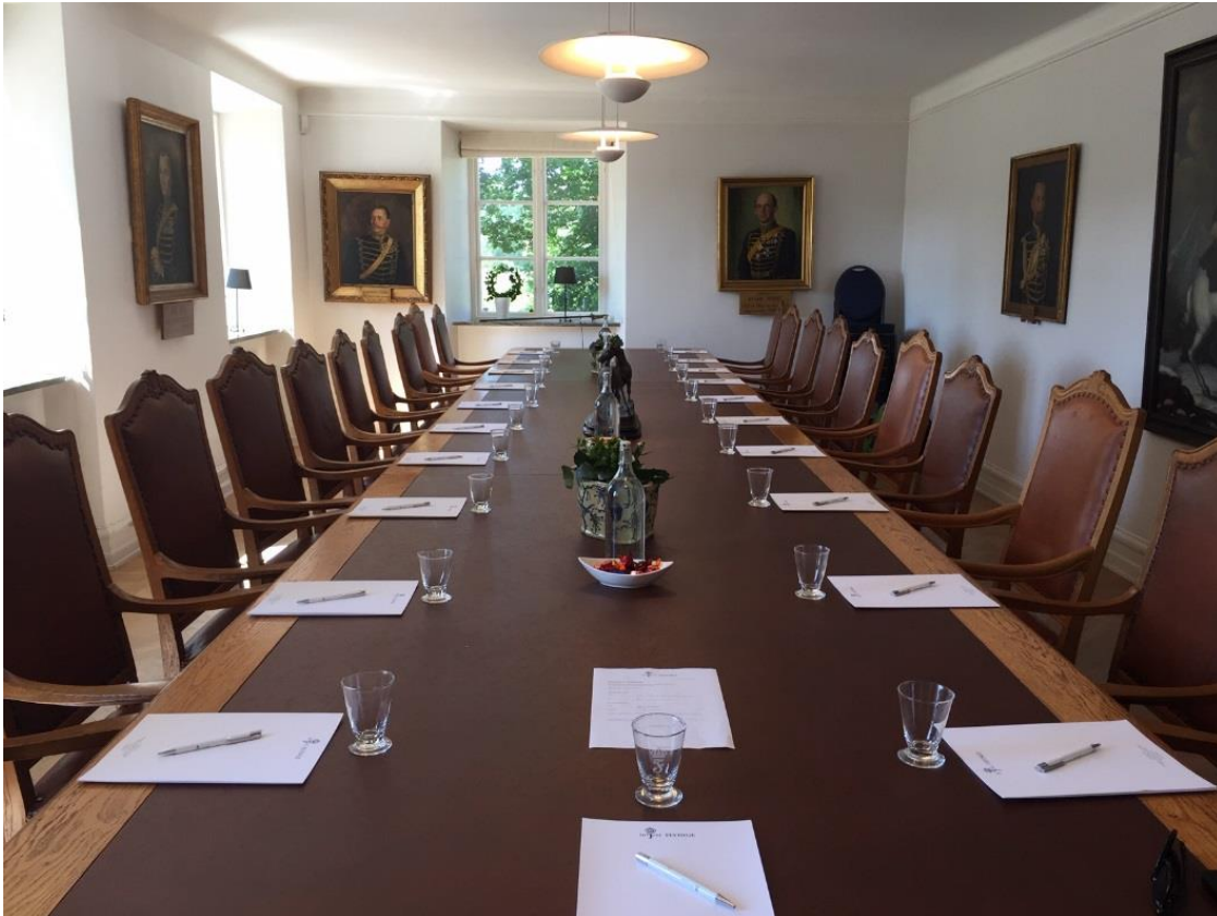
Så här trevligt kan ett styrelse bord se ut Bild från Flyinge under distriktens Tjänstemannakonferens