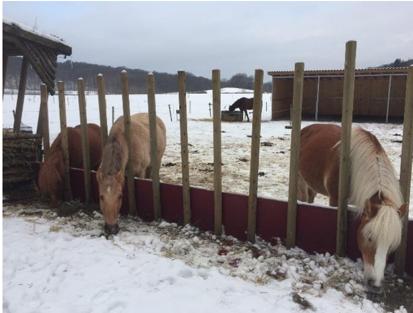
Hästar i lösdrift på Göteborgs Handikappridklubb