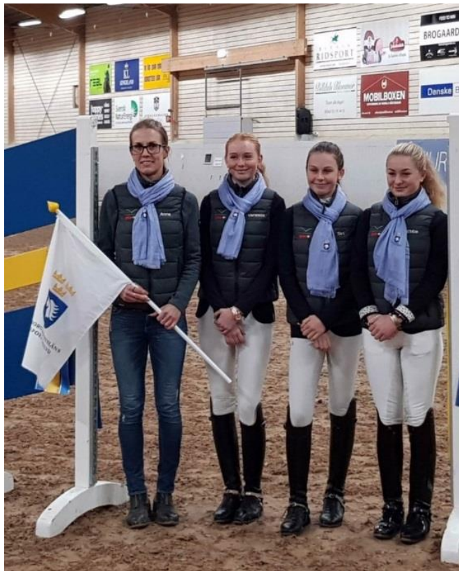
De duktiga Lag SM vinnarna med lagledaren i ponny dressyr Göteborg & Bohusläns Ridsportförbund lag 1 De vann GULD på Lag SM i dressyr som gick på Billdals Ridklubb