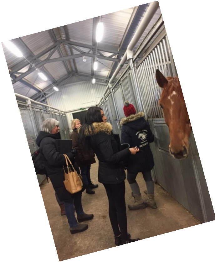
Besöksgruppen ute hos föreningar, både hos Bulycke Rf och på Stenungsunds Rk