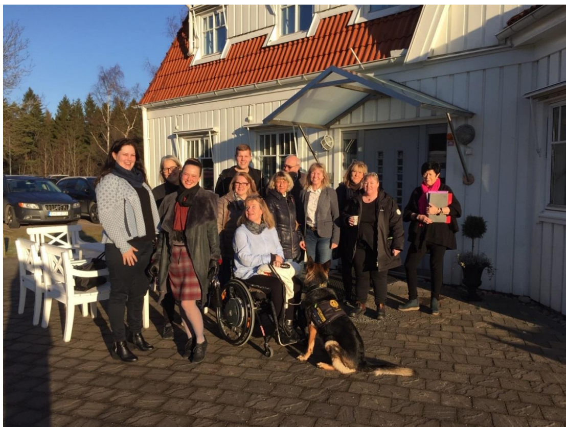
Domare och överdomare i hoppning samlade på Stenungsbaden för repetitionskurs 2018