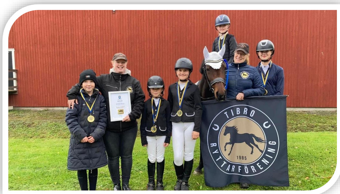
Tibro RF – vinnare Gota ponnyhoppning