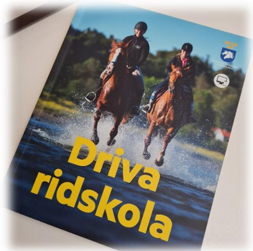
Digitala Ridskolechefsträffar är fortsatt ett stående inslag i vår kalender.