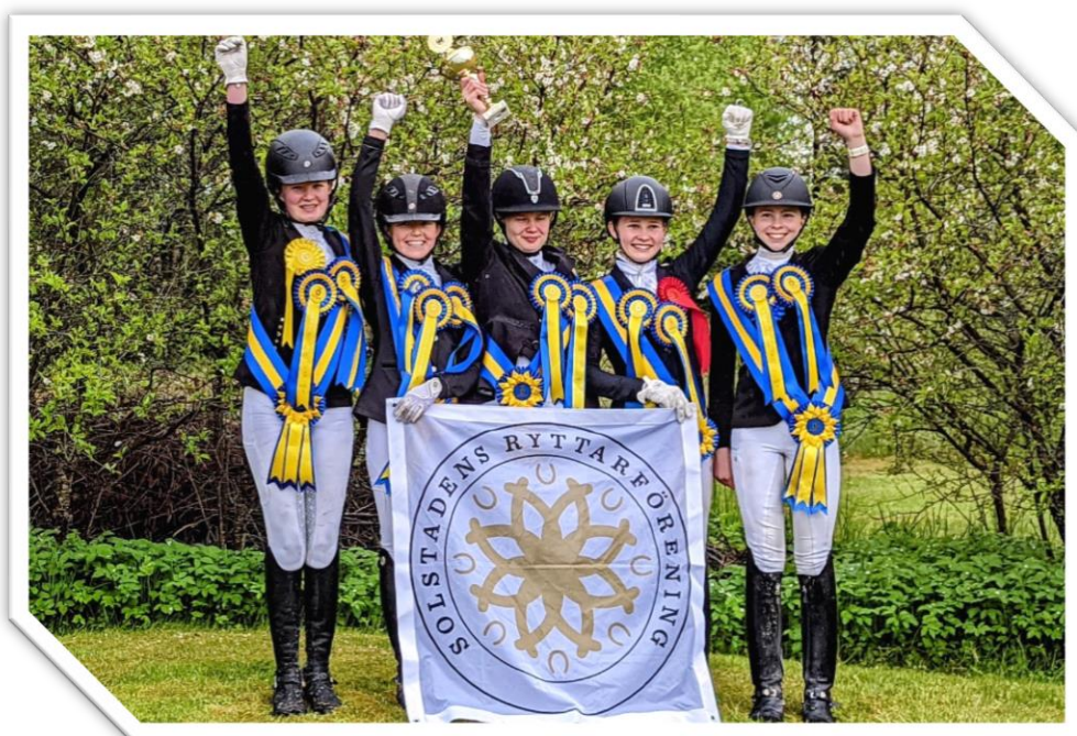
Solstadens RF – vinnare Ponnyallsvenskan dressyr div I