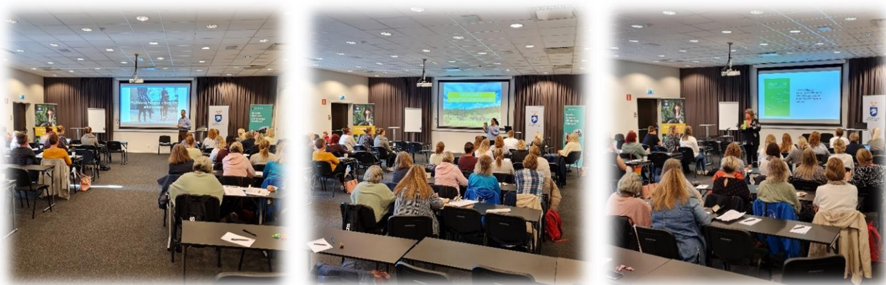
Bilder ifrån årets Ridskolekonferens som hölls på Quality Hotell i Vänersborg.

Under 2022 kunde vi äntligen även genomföra en Ridskolekonferens igen. Detta gjordes i gott samarbete med både RF-SISU och med Svenska Ridsportförbundet och helgen blev mycket lyckad!