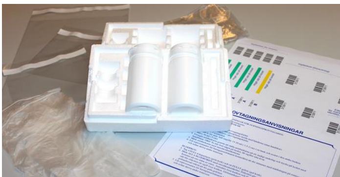
Provtagningskit för urin.

Urin ska vara spontant avgiven och uppsamlad i håv (provtagningskärl) med en ren plastpåse eller speciell urinsuspensoar.