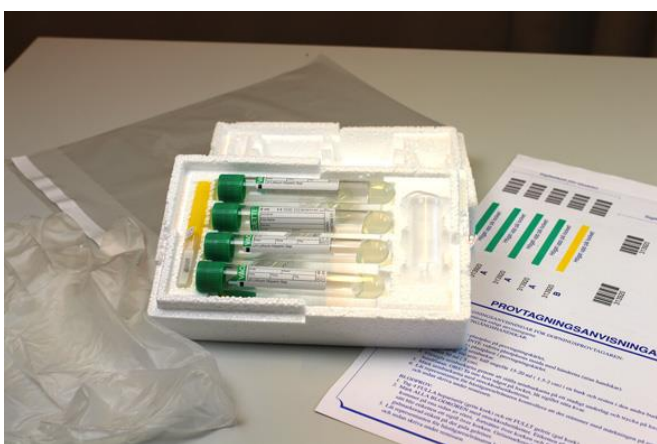
Provtagningskit för blod