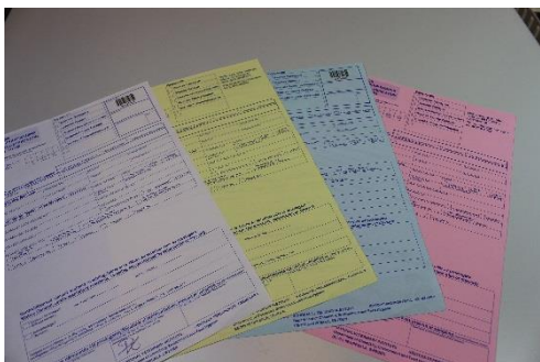
Remiss för dopningsprovtagning

8. Remiss för dopingprovtagning har tagits fram av sportförbunden och SVA i samarbete. Använd dem så här: