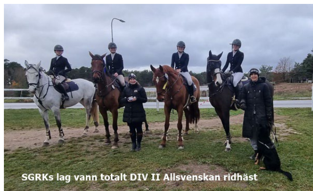
SGRKs lag vann totalt DIV II Allsvenskan ridhäst