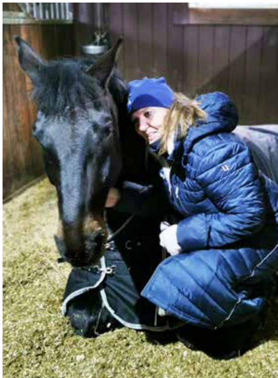
Lena och MyNumberOne har vilat sig i form!

Ja jösses, vilket konstigt år vi har haft! Mycket har förändrats, massor har vi lärt oss – men till stora delar är också allt som förut, vi måste bara lära oss att tänka på ett annat sätt och kanske är det just det som är en av de största utmaningarna.